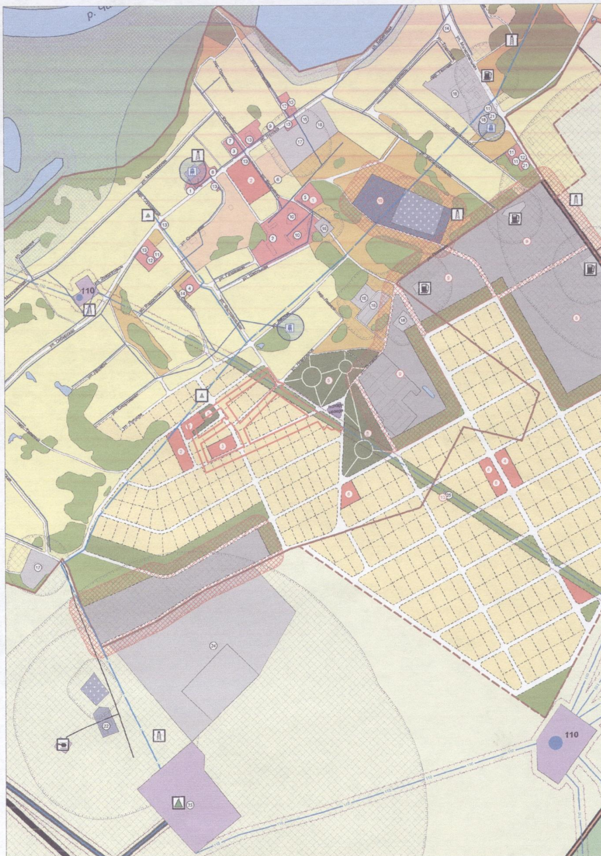
Схема расположения элемента планировочной структуры